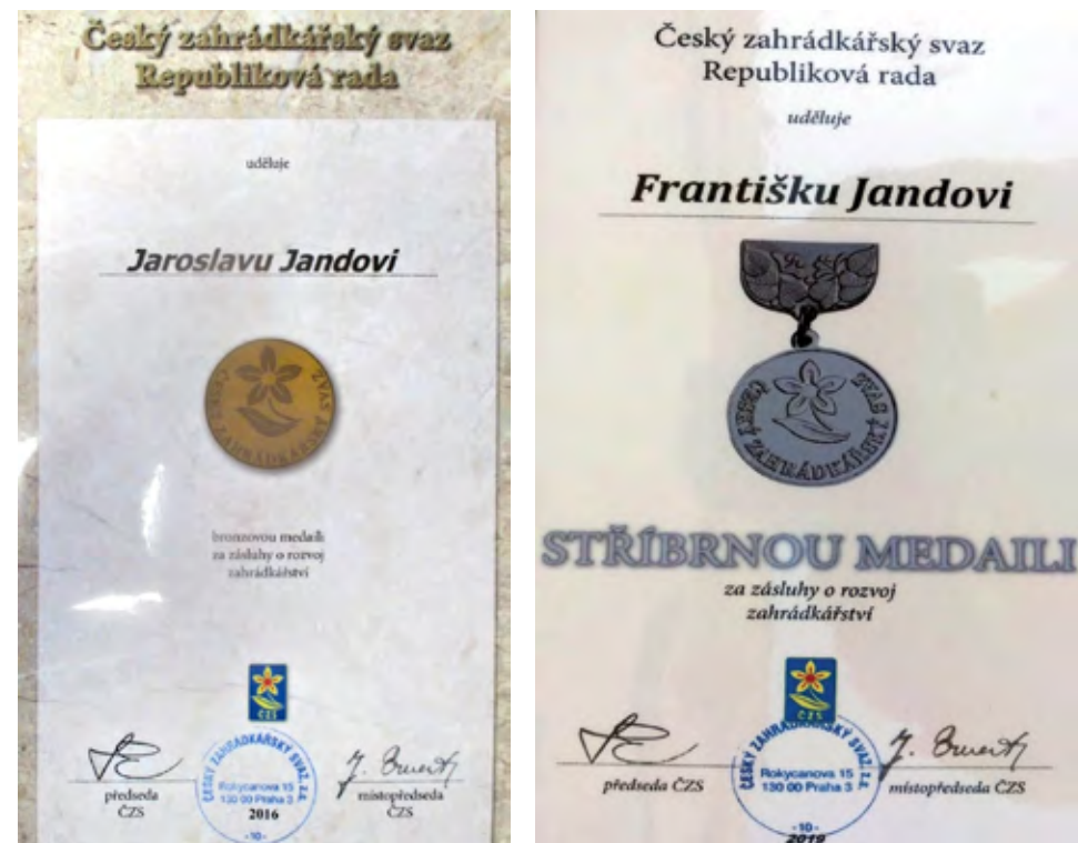
Ocenění od Republikové rady ČZS r. 2016