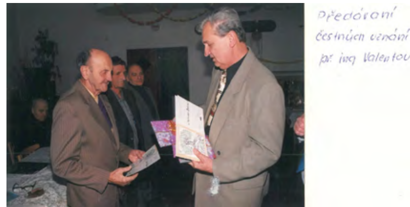
Čestná uznání pro členy ZO Horní Moštěnice: