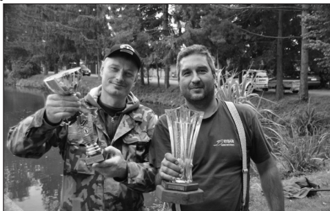
Spolkové rybářské závody