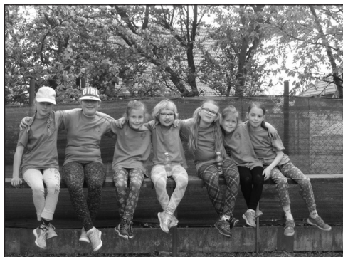
Foto z našich akcí naleznete na http://krouzeksance.rajce.idnes.cz/

Všem dětem, rodičům a občanům Horní Moštěnice přejeme krásné prožití letních prázdnin.