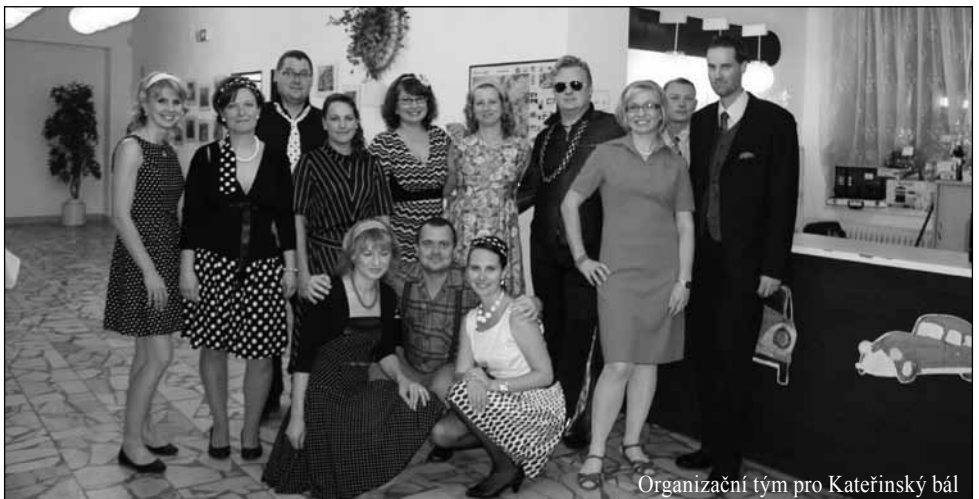
Organizační tým pro Kateřinský bál