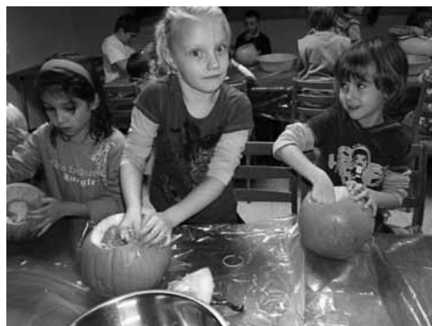
Foto ze všech našich schůzek a akcí najdete na http://krouzeksance.rajce.idnes.cz/

V neděli ráno 6. října se náš kroužek vydal na výlet vlakem do zoologické zahrady